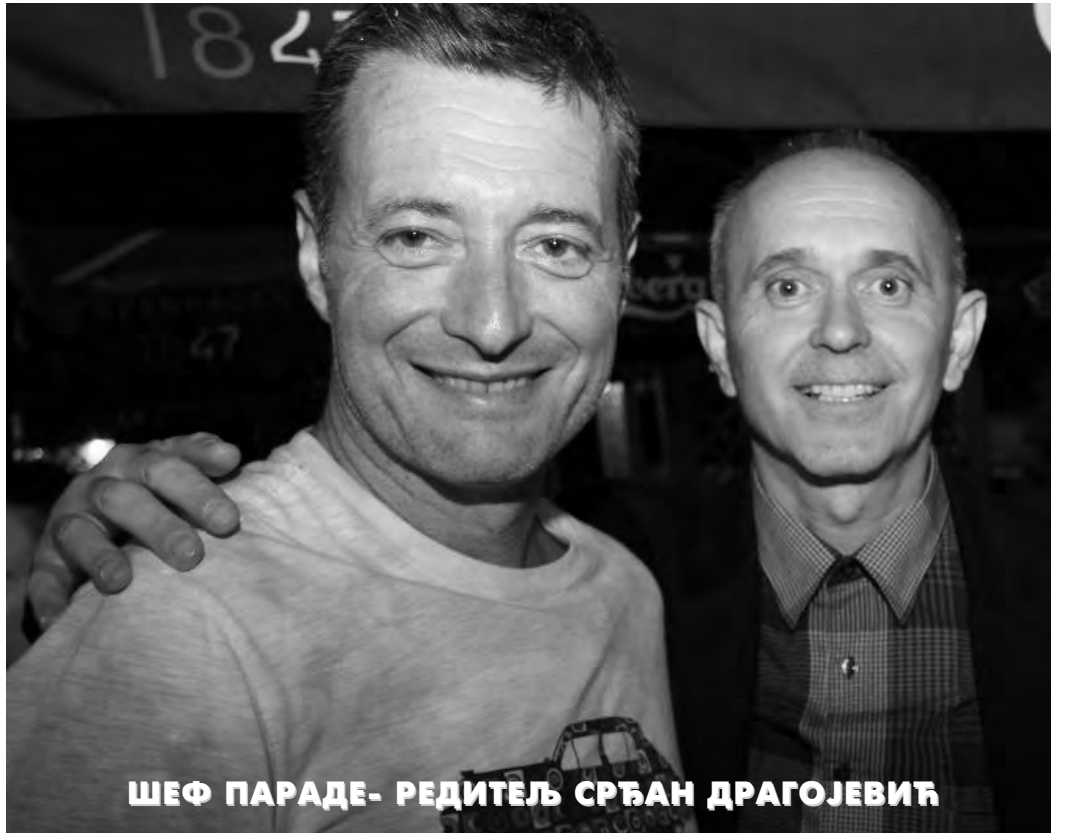
ШЕФ ПАРАДЕ- РЕДИТЕЉ СРЂАН ДРАГОЈЕВИЋ

Потписник овог текста је имао ту част и привилегију али истовремено и незахвалну дужност да као члан Жирија одлучује о наградама. Изузетно је тешко вредновати уметност и третирати је као такмичарски спорт. Уметност није трка на сто